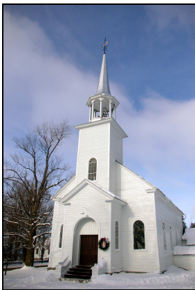
Église anglicane Saint-Paul